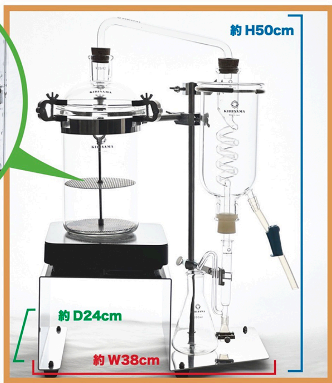
乾燥ラベンダーを使った使用例